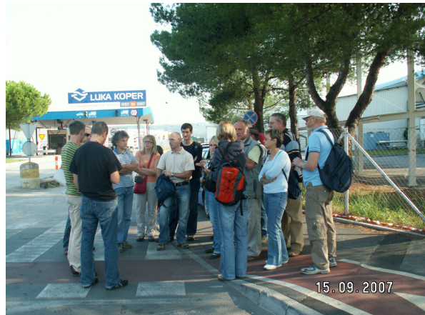
Pred vhodom v Luko Koper